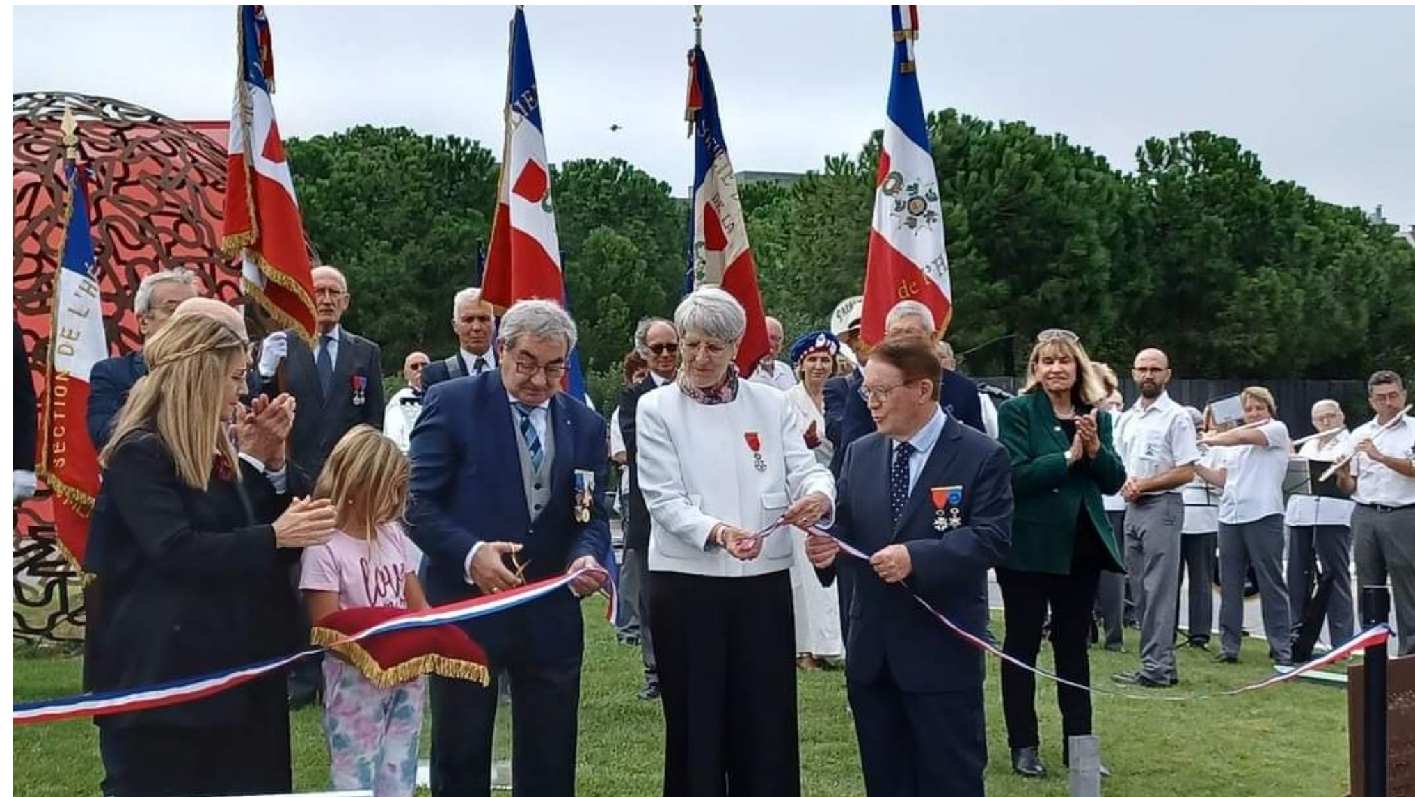
Samedi 22 octobre, inauguration du rond-point des Ordres nationaux, en présence de la secrétaire d'Etat chargée des Anciens combattants et de la Mémoire.