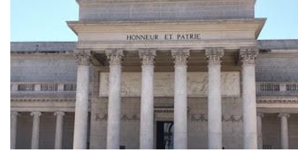
San Francisco : le musée de la Légion d'honneur.