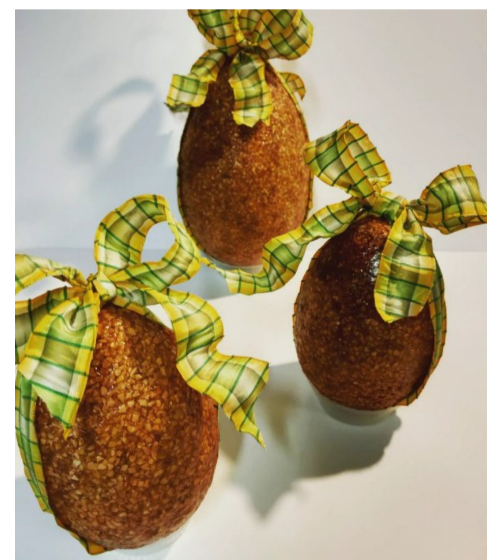
Les créations 2022 de la pâtisserie Py